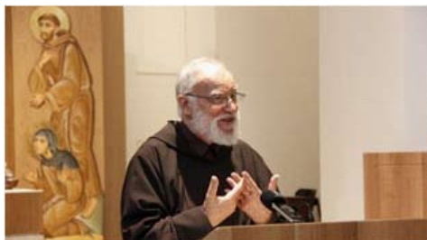
p. Raniero Cantalamessa

Več preberite na spletni strani radia Ognjišče.